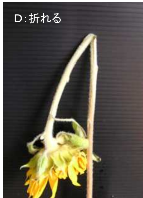
花茎の曲がり・折れ