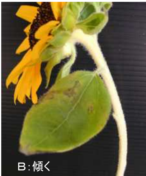
舌状花花弁の萎れ