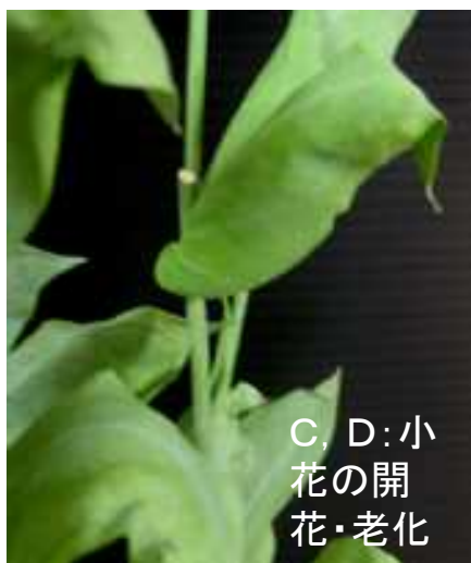
C, D: 小花の開花・老化