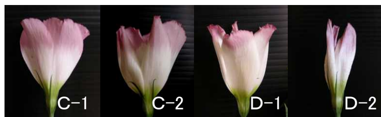
小花の開花・老化