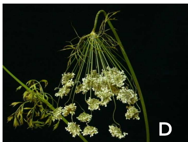
花房全体がベントネック