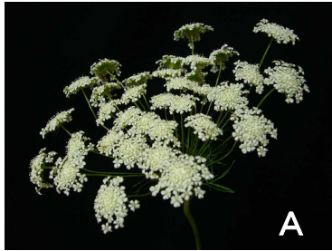
ベントネックがない