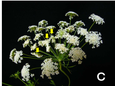
散形花序の1/2未満がベントネック