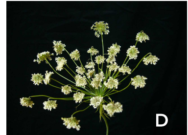
散形花序の1/2以上がベントネック