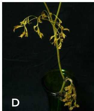
中位葉の褐変・下葉の枯死