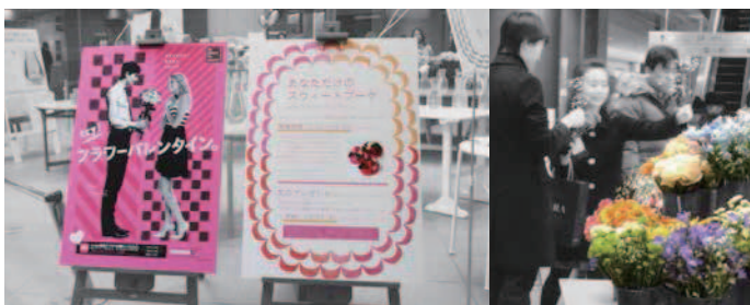
全国の花関係者が一体となって取り組んでいます。メジャーな商業施設のコラボ先も多く、着実に定着しています。【写真(上段)渋谷ヒカリエ/(下段)六本木ヒルズ】