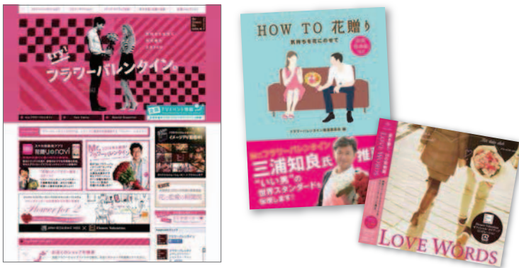
書籍、CD、映画館でのCM(ショートムービー)など、花店以外でも積極的にアピール!

フラワーバレンタインのキャンペーン活動では、花業界が一丸となって、「男性から女性に花を贈る2月14日」の定着を目指し、取り組んできました。この活動は、フラワーバレンタインという新しい物日の創出に留まらず、日本における「男性の花贈り」という今までなかったマーケットを創造する“きっかけ”作りと私たちは考えています。実際、スタート3年目からは、バレンタインデーに限らず、ホワイトデーやいい夫婦の日、クリスマスなど、年間を通じて花店に男性客が増える、という現象が起きており、フラワーバレンタインの本来の目的に近づいてきています。そしてこれらは、全国の花関係者の熱意と協力で、都心部のみならず地方にも波及しています。 今後も新たなお客様を創造していくテーマに集中し、共感してくださる業界内外のパワーを結集して、花や緑のマーケットのパイをどんどん拡大していきます。