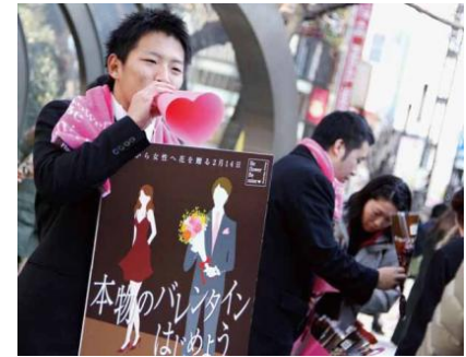
イベントの様子(2011年)