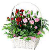
2010年3.5号鉢を使用した母の日商品

名前の通りのキュートな カーネーション♪ ピンクの繊細なグラデーションが 可愛さを強調します。