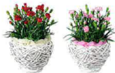
2010年5号鉢を使用した母の日商品

花びら一枚一枚に 濃いピンクの線が入り、 ひとつの花でピンク色の濃淡を お楽しみいただけます。