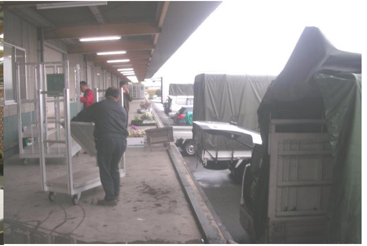
<組合員の出展花材の搬入>