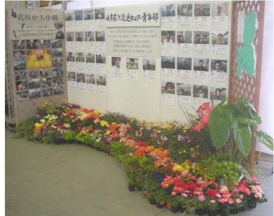
＜青年部活動紹介コーナー＞