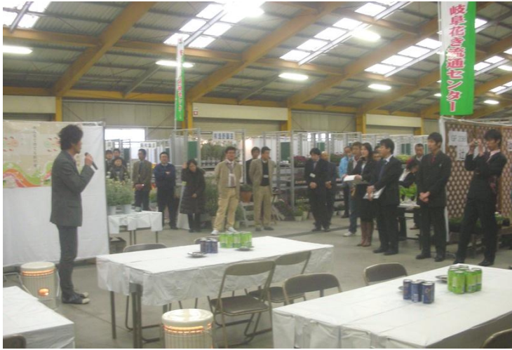
<組合長の開会挨拶>