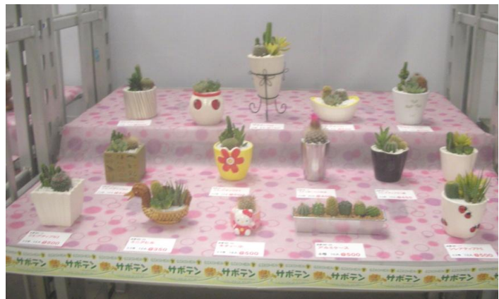
＜組合員の創意工夫された出展ブース＞