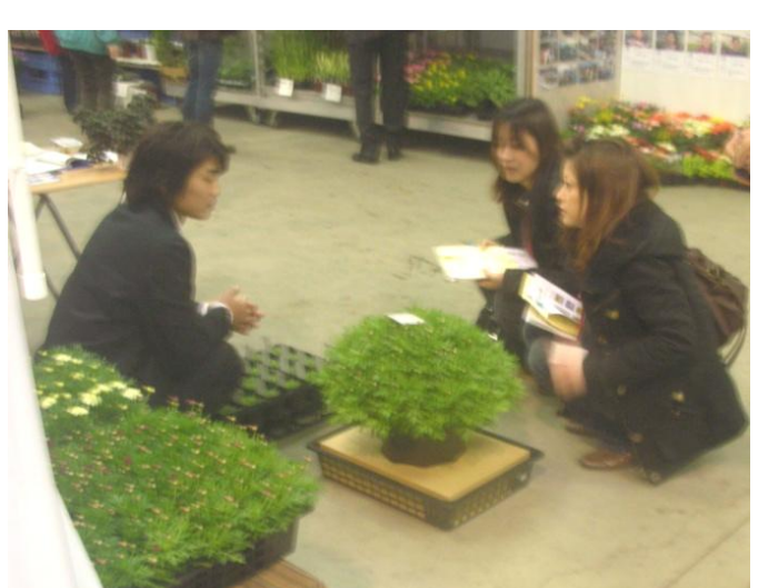
<内覧会における商談・情報交換>