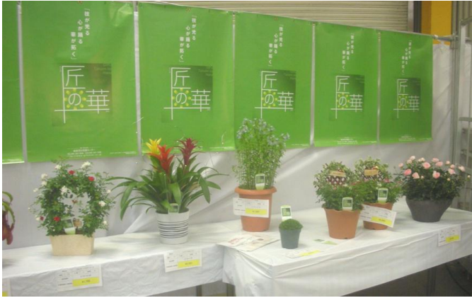
＜「匠の華」の展示紹介コーナー＞