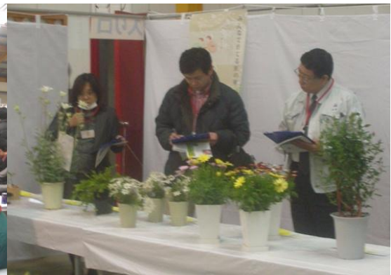
＜来場者による「匠の華」の審査＞