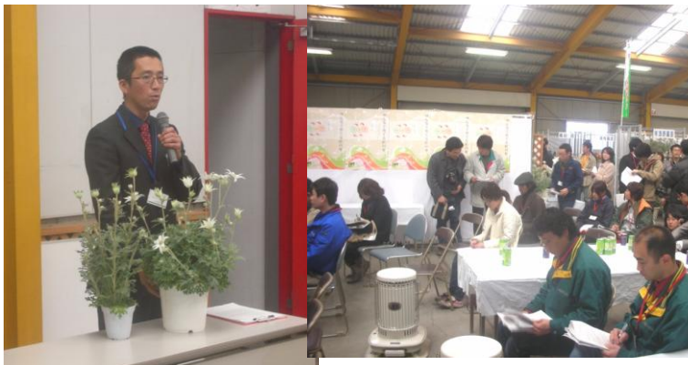
＜店頭における栽培管理セミナー＞