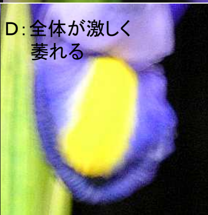
D: 全体が激しく 萎れる