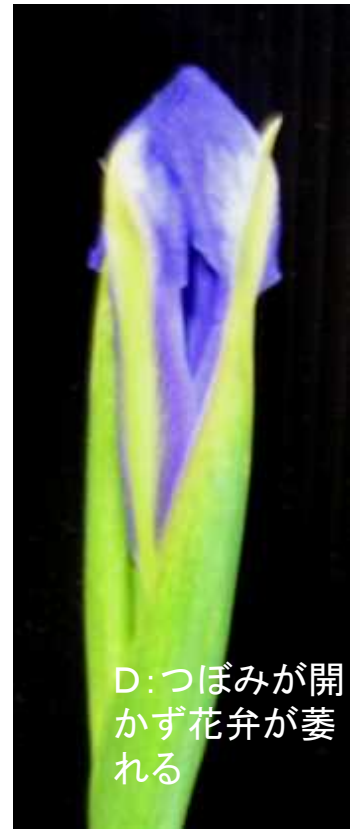
D: つぼみが開 かず花弁が萎 れる